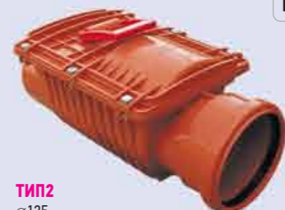
ТИП2 Ø125 9-5020-125-00-03-11