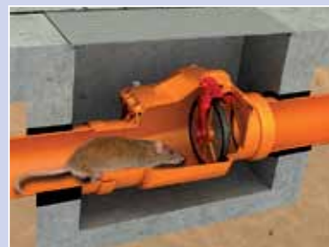
Защита от грызунов