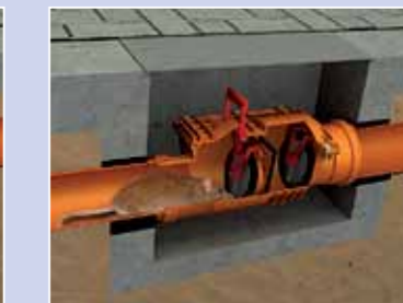
Двойная защита от грызунов