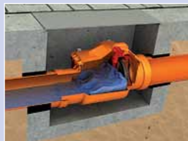
Заблокированный клапан - защита от подпора