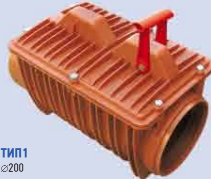
ТИП1 Ø200 9-5000-200-00-03-11