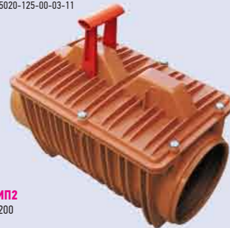
ТИП2 Ø200 9-5020-200-00-03-11