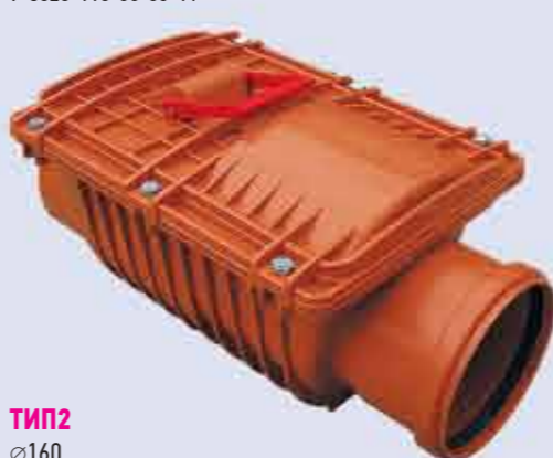
ТИП2 Ø160 9-5020-160-00-03-11