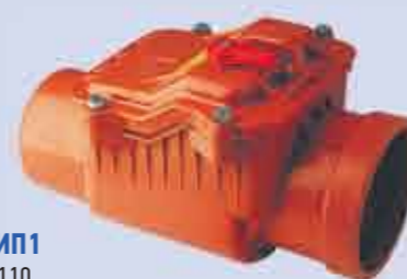
ТИП1 Ø110 9-5000-110-00-03-11